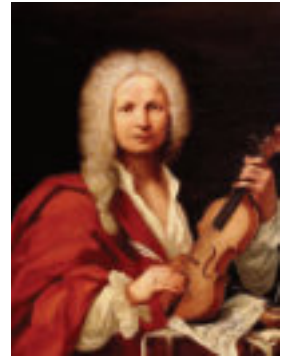
Vivaldi, Öl auf Leinwand, unbekannter Maler, 1723

Lieder des Monats: Juni: EG 642 | Juli: EG 646 | August: EG 630